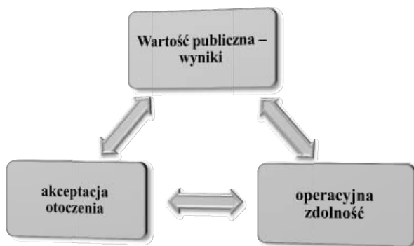
Rysunek 2. Trójkąt strategiczny wartości publicznej