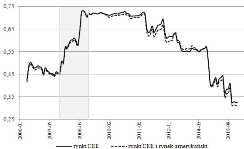
Rysunek 2. Wskaźniki integracji rynków CEE oraz rynku amerykańskiego

wartość wskaźnika utrzymywała się w tej grupie zdecydowanie dłużej niż w przypadku pierwszej analizowanej grupy, bo aż do września 2011 roku. Od tego momentu widoczny jest w zasadzie trend spadkowy wskaźnika.