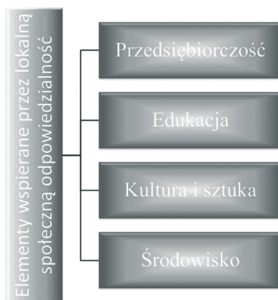
Rysunek 4. Elementy, w zakresie których podmioty podejmują działania lokalnej społecznej odpowiedzialności