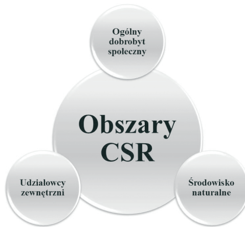
Rysunek 3. Obszary CSR według R.W. Griffina