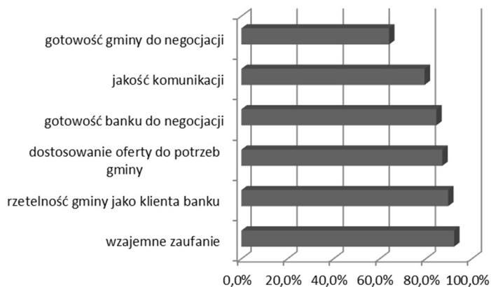
Rysunek 1. Ocena elementów współpracy bank i samorząd (ocena przedstawicieli banków – suma oceny bardzo dobrze i dobrze)

Współpraca badanych podmiotów jest oparta przede wszystkim na takich elementach, jak wzajemne zaufanie, rzetelność, dopasowanie oferty do potrzeb, komunikacja, gotowość stron do negocjacji warunków. Jak się okazało, przedstawiciele banków na poziomie dobrym i bardzo dobrym ocenili w pierwszej kolejności wzajemne zaufanie (92,3%) oraz rzetelność gminy jako klienta (89,7%), następnie dostosowanie oferty do potrzeb gminy (87,2%), gotowość banku do negocjacji (85%), jakość komunikacji (79,5%) oraz gotowość samorządu do negocjacji warunków (64,1%) (rysunek 1).